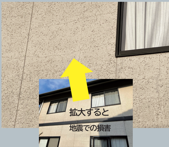
「一見なんともない外壁が…」 2024 2/3(土)