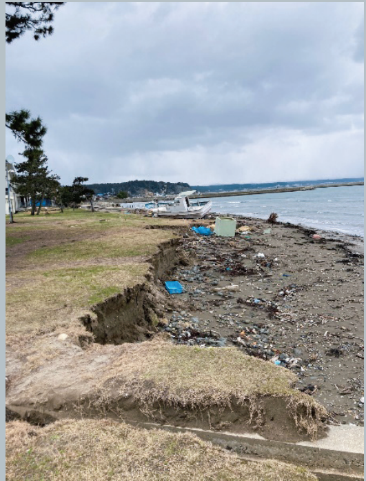
輪島・珠洲 立会の際 見附島へ 2024 2/23(金)

しかし現状はどうでしょうか？ 半年以上経って、能登「復興」には程遠い状況です。継続的な応援が必要と感じています。能登に足を運ぶ！能登産のものを楽しむ！そういうことで永く永く応援し続けます！